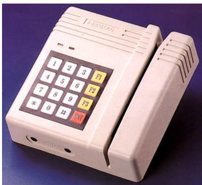
AC905 - Terminal autónomo de control de accesos (Banda Magnética).